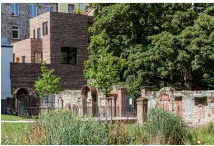
NKBAK: STYLEPARK NEUBAU AM PETERSKIRCHHOF, FRANKFURT AM MAIN