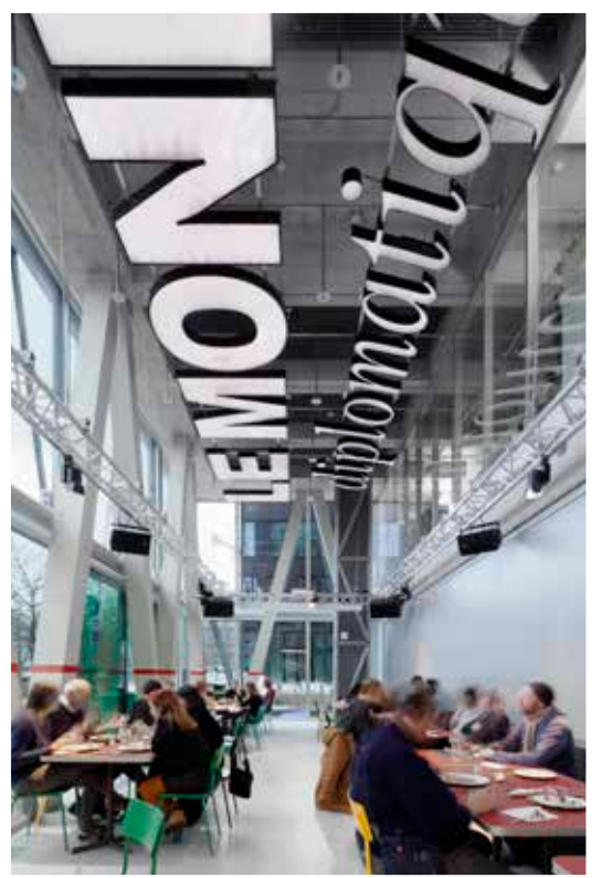
E2A: TAZ NEUBAU, REDAKTIONS- UND VERLAGSGEBÄUDE, BERLIN