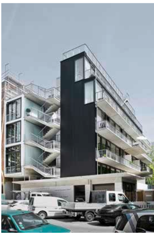
ORANGE ARCHITEKTEN: "EINFACH GEBAUT", WOHNHAUS, BERLIN