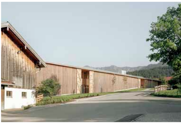
FLORIAN NAGLER ARCHITEKTEN: EINGANGSGEBÄUDE FREILICHTMUSEUM GLENTELEITEN