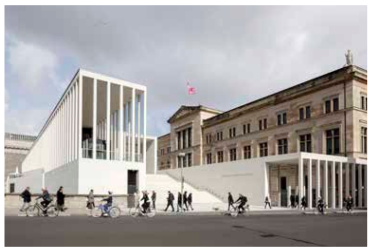
DAVID CHIPPERFIELD ARCHITECTS: JAMES-SIMON-GALERIE, BERLIN